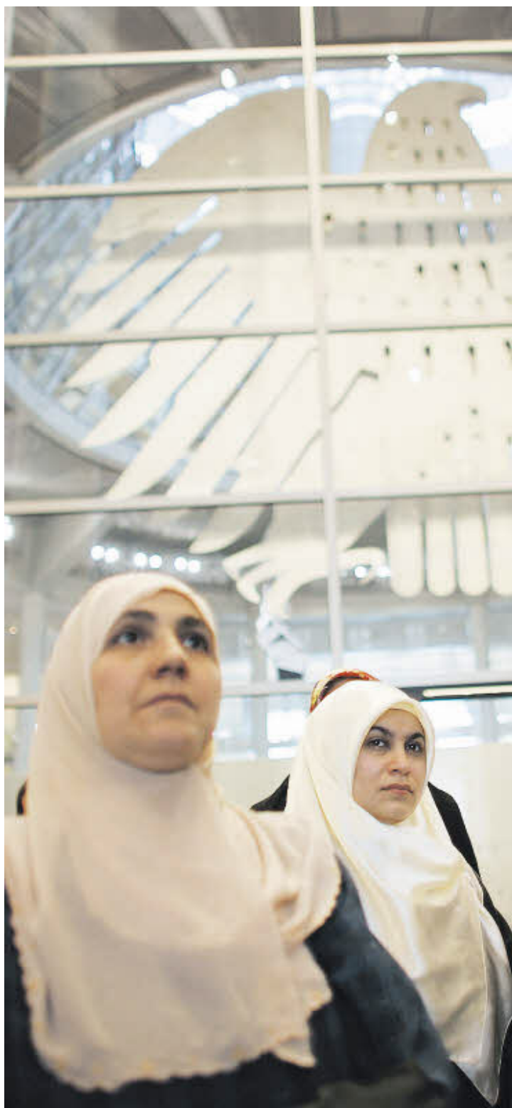
Mitten im Politischen: Musliminnen im Bundestag.

Die bisher unveröffentlichte Studie 2009, die der FR in Auszügen vorliegt, geht von 1,1 Millionen muslimischen Wahlberechtigten aus – rund 1,7 Prozent der Wahlberechtigten insgesamt. Die neue Studie erhebt, wie Muslime wählen. Auf diese Umfrage wird Frank-Walter Steinmeier (SPD) mit gemischten Gefühlen blicken: Die Sozialdemokraten liegen mit